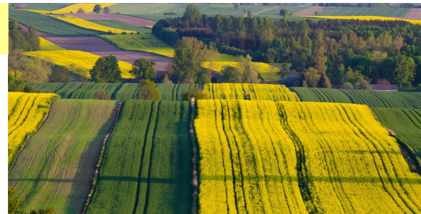
Park Krajobrazowy „Góra Św. Anny” (Wyżyna Śląska)