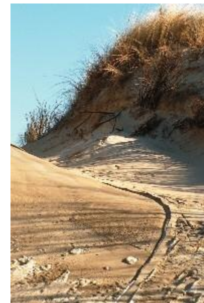
Nadmorski Park Krajobrazowy