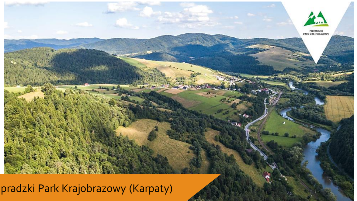
Popradzki Park Krajobrazowy (Karpaty)