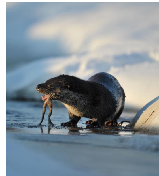
Park Krajobrazowy Pojezierza Ławskiego