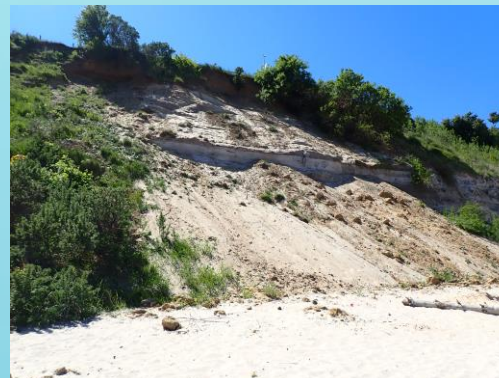
Fot. Widok na klif.