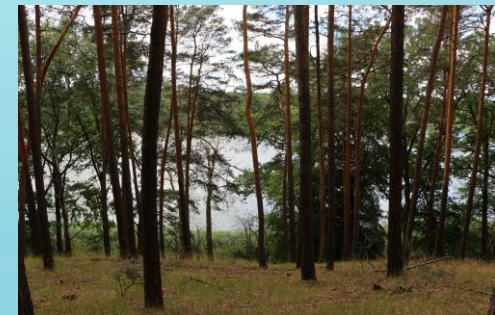
Fot. Widok na Jezioro Rybojadło położnego na granicy Miedzichowskiego i Pszczewskiego PK. (Wyk. Karolina Ferenc)