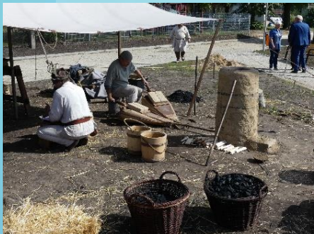
Fot. Festyn archeologiczny w Miedzichowie. (Wyk. Artur Golis)