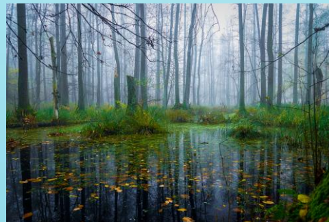
Fot. Łęgi i olsy – bogate gatunkowo zbiorowiska leśne w PK Dolina Baryczy