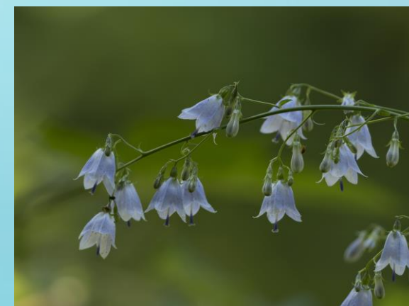
Fot. Dzwonecznik wonny (Wyk. Cezary Werpachowski)