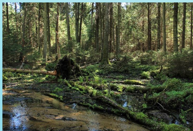
Fot. Puszcza Knyszyńska