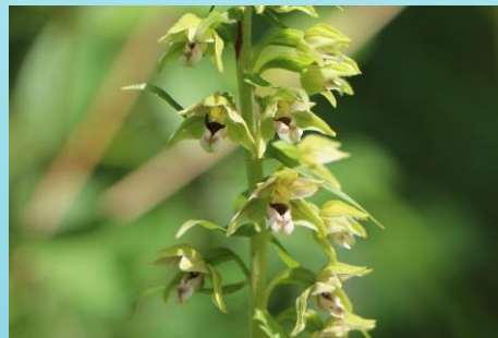
Fot. Kruszczyk szerokolistny, najczęściej występujący gatunek storczyka w Miedzichowskim PK.