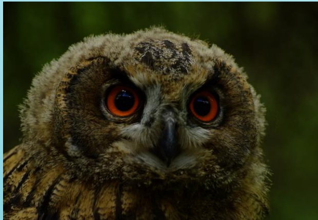
Fot. Puchacz (Wyk. Łukasz Głowacki)