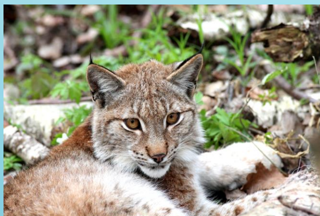
Fot. Ryś. (Wyk. Adam Sacharewicz)