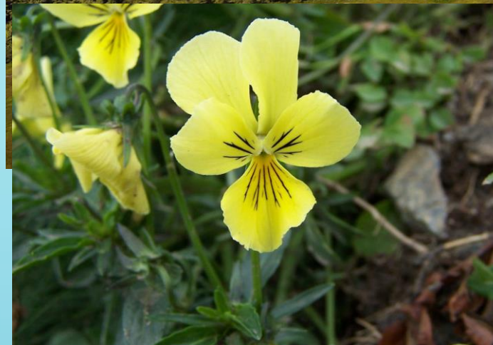
Fot. Fiołek żółty sudecki (Wyk. Opiola Jerzy - praca własna CC BY-SA 3.0b Viola sudetica a1 - Fiołek żółty sudecki - Wikipedia, wolna encyklopedia)