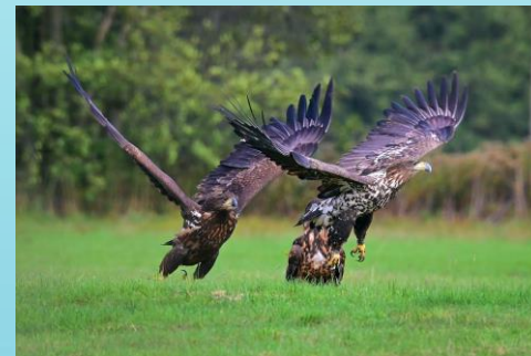
Fot. Bieliki (Wyk. Wojtek Broda)