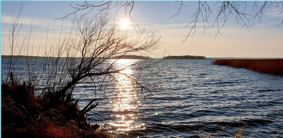
Fot. Jezioro Śniardwy – największe polskie jezioro.

To też w jego granicach znajduje się największe polskie jezioro - Śniardwy.