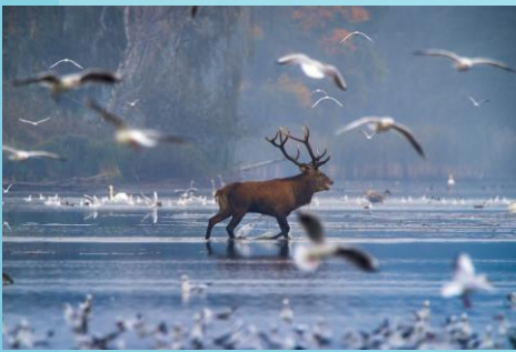
Fot. Samiec jelenia, brodzący wśród ptaków wodnych