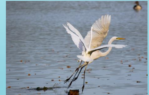
Fot. Para czapli białych wzbijających się w powietrze