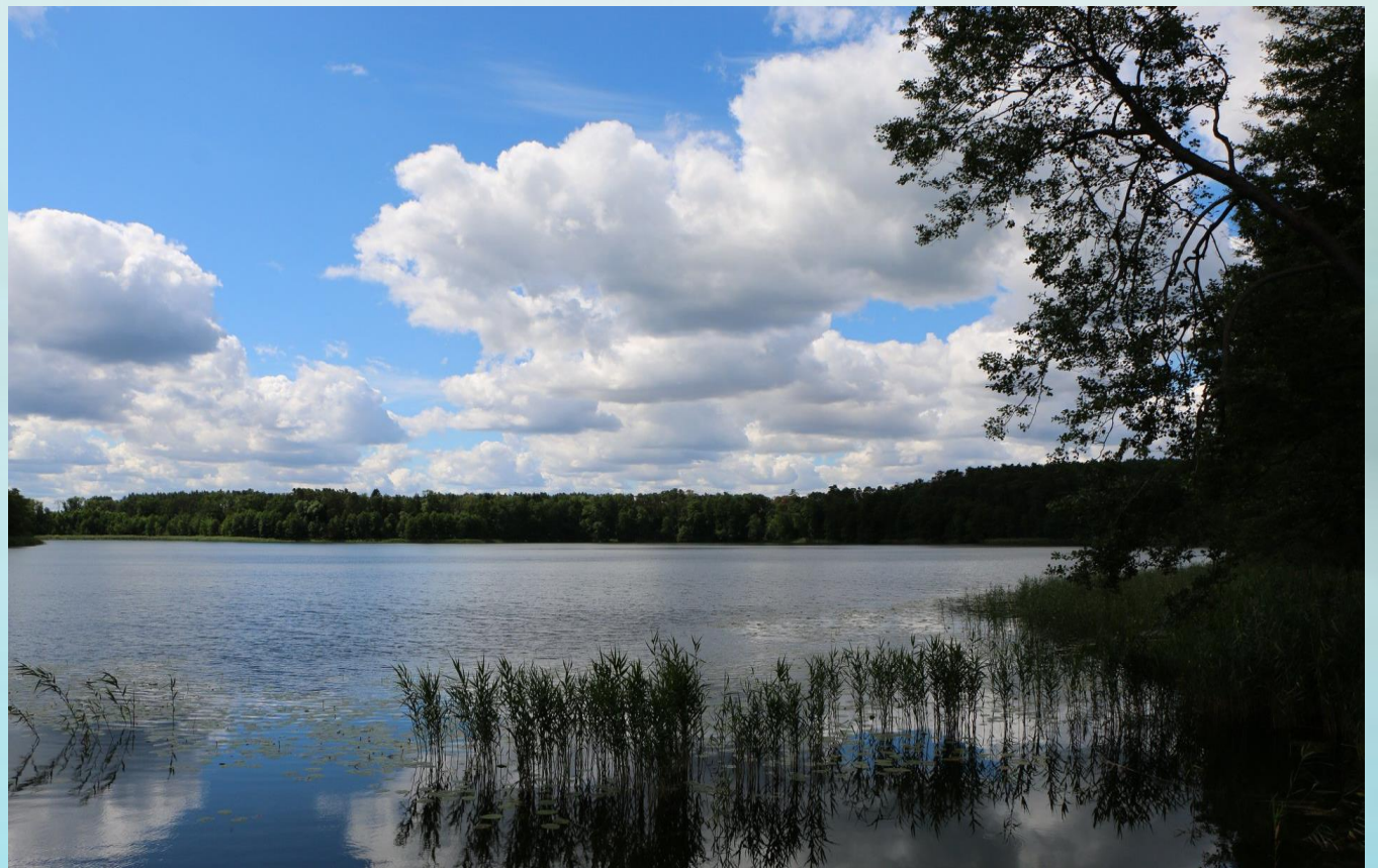
Fot. Krajobraz charakterystyczny dla Miedzichowskiego PK, widok na Jezioro Głębokie. (Wyk. Karolina Ferenc)

Miedzichowski Park Krajobrazowy do 2019 roku był częścią Pszczewskiego Parku Krajobrazowego. Wtedy to jego część leżąca w województwie wielkopolskim stała się niezależną jednostką – Miedzichowskim PK . Park ten to bory, łąki i trzęsawiska na wschód od Jeziora Wielkiego i Rybojadło, na granicy z woj. lubuskim. Założony w lasach, które kolonizowali osadnicy ołęderscy. Byli to chłopi, którzy przybyli na te ziemie z obecnych terenów Danii, Niemiec i Holandii. Posiadali oni m.in. dużą wiedzę w zakresie kultury rolnej oraz melioracji.