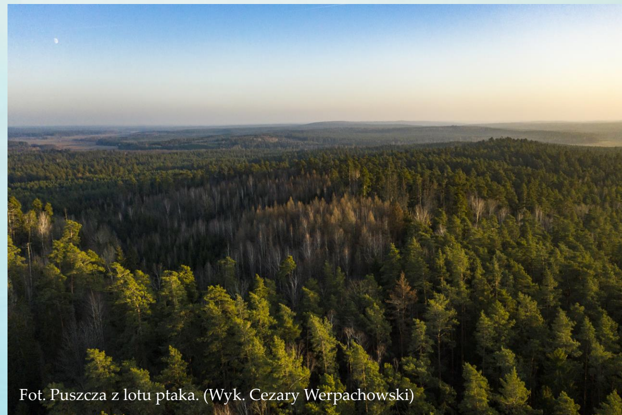
Fot. Puszcza z lotu ptaka.

PK Puszczy Knyszyńskiej im. Witolda Sławińskiego to rekordzista wśród polskich parków jeśli chodzi o liczbę rezerwatów przyrody. Jest ich tu łącznie aż 21, z czego 2 położone są w jego otulinie. Położony we wschodniej części województwa podlaskiego park cechuje się obszarem o wysokim stopniu naturalności i stosunkowo niewielkim poziomem zanieczyszczeń. Celem ochrony parku stał się jeden z najlepiej zachowanych kompleksów leśnych w Polsce, o charakterze borealnym – typowy dla obszarów położonych w północnej części Eurazji. Dzikość tych obszarów sprzyja występowaniu tak rzadkich już gatunków ssaków jak chociażby ryś.