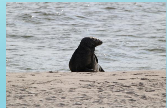
Fot. Foka szara (Wyk. A. Zapart)