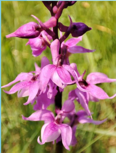
Fot. Storczyk męski (Wyk. Łukasz Głowacki)

Park Krajobrazowy mogący się pochwalić najwyższym szczytem wśród polskich parków krajobrazowych jest Śnieżnicki PK obejmujący najwyższą, poza Karkonoszami, część Sudetów, których rangę porównać można jedynie z Karkonoskim Parkiem Narodowym. Najwyższym szczytem, który się tu znajduje jest oczywiście Śnieżnik o wysokości 1425 m n.p.m. To tu znajduje się najwięcej stanowisk w Sudetach (poza Karkonoszami) gatunków roślin i zwierząt górskich i wysokogórskich żyją tu m.in. fiołek żółty sudecki oraz siwerniak.