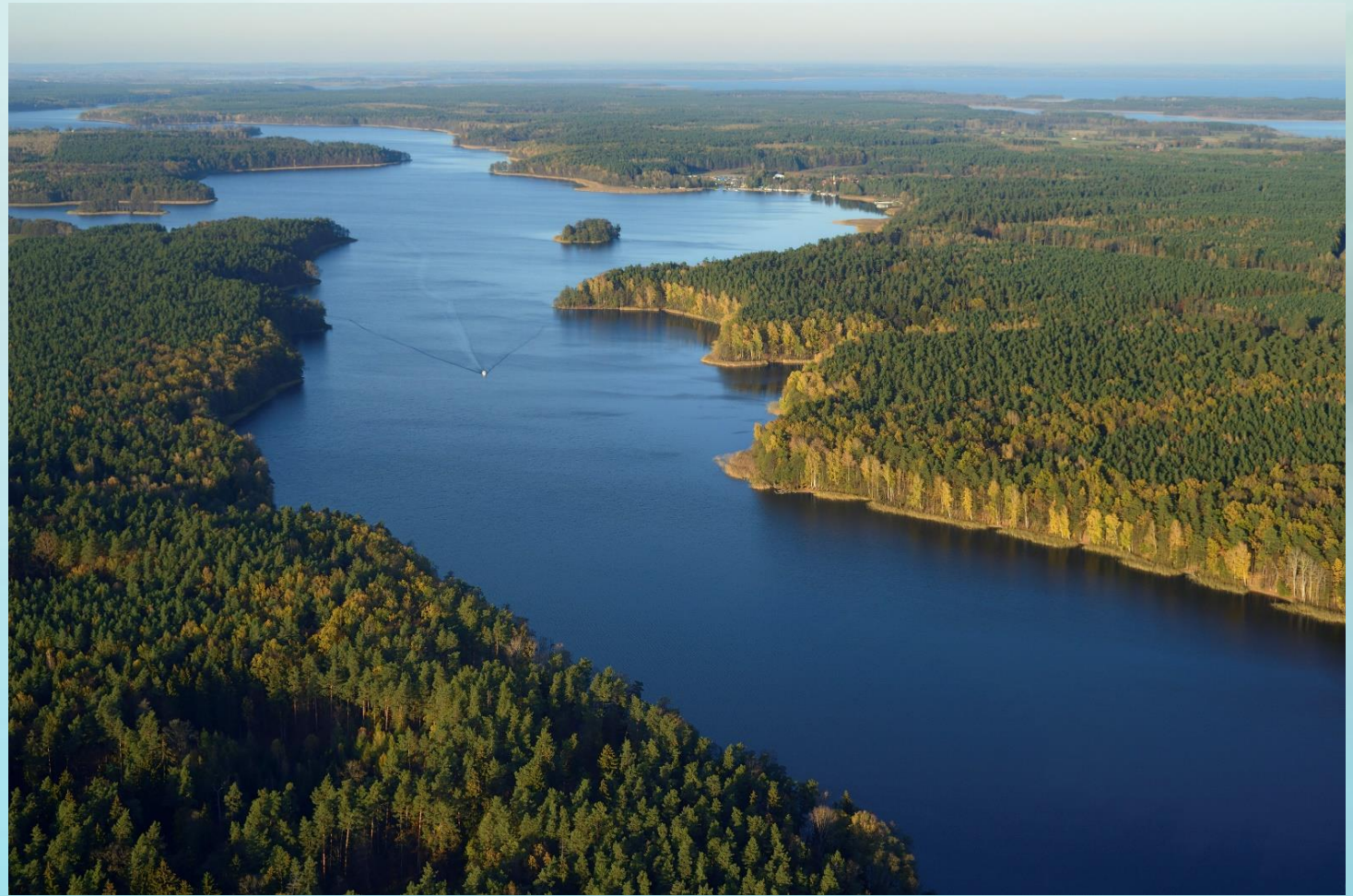
Fot. Jedno z jezior rynnowych, krajobraz charakterystyczny dla Mazurskiego PK. (Wyk. Waldemar Bzura)