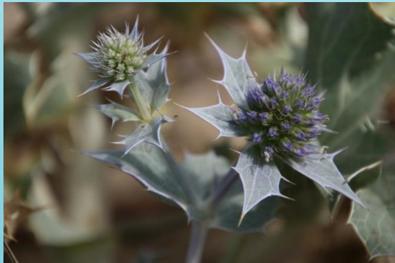
Fot. Mikołajek nadmorski (Wyk. A. Zapart)