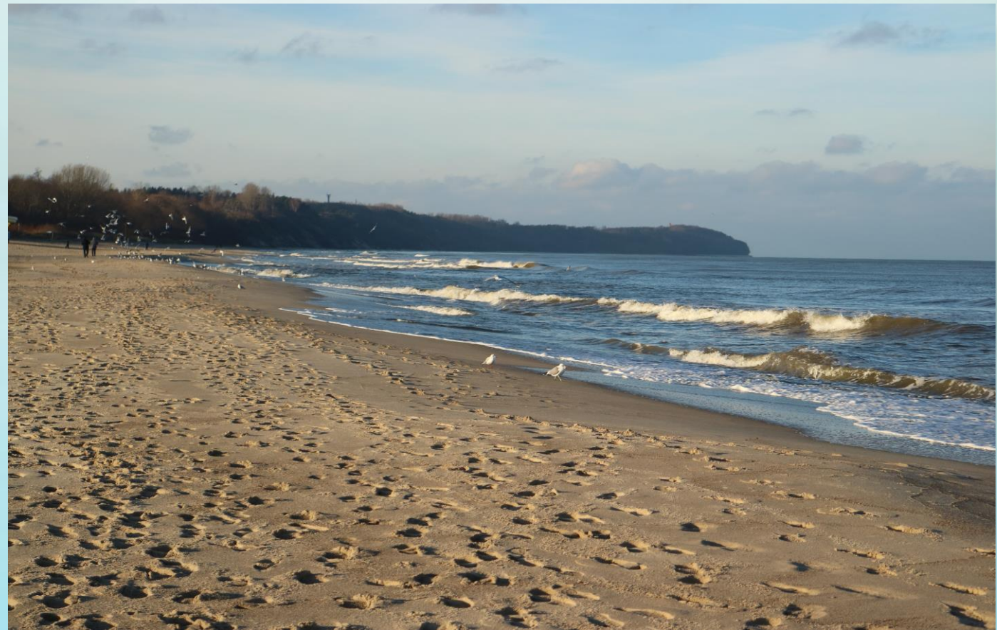
Fot. Charakterystyczny krajobraz Nadmorskiego PK, w tle przylądek Rozewie.

Położonym najbardziej na północ naszego kraju jest Nadmorski PK . Ponad połowa powierzchni tego parku to wody zatoki Puckiej Wewnętrznej, która jest oddzielona od reszty akwenu Zatoki piaszczystym, podłużnym wypłyceciem zwanym Ryfem Mew. Część lądowa obejmuje całość Półwyspu Helskiego oraz wąski pas wybrzeża morskiego. Na terenie Nadmorskiego PK i jego otuliny utworzono, aż 13 rezerwatów przyrody. Spotkamy tu gatunki, charakterystyczne dla wybrzeża, takie jak chociażby mikołajek nadmorski czy foka szara.