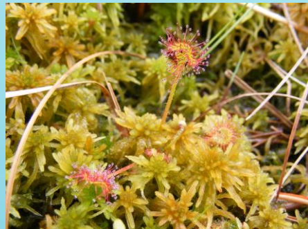
Fot. Rosiczka okrągłolistna, gatunek charakterystyczny dla torfowisk.