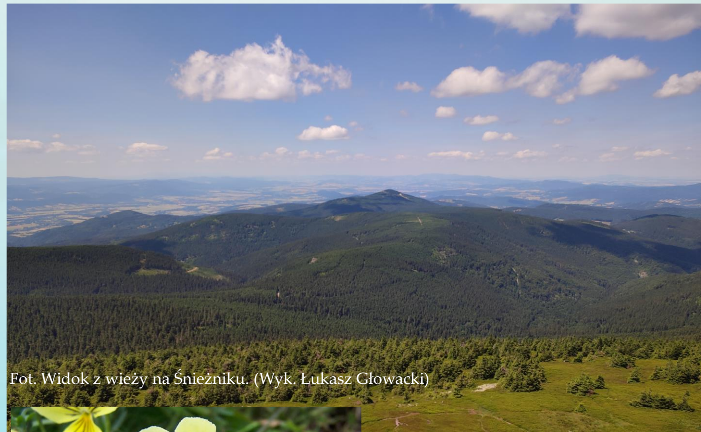
Fot. Widok z wieży na Śnieżniku.